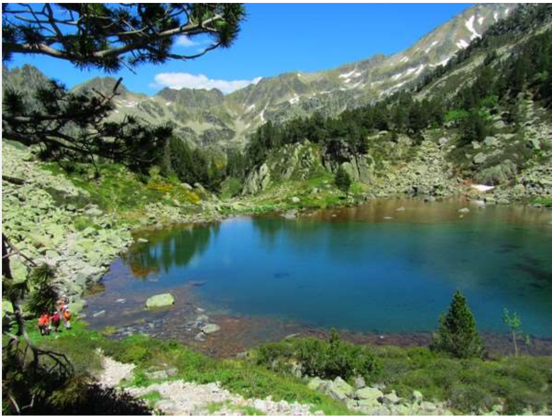
Randonnée vers l'étang des Bésines, depuis la gare de L'Hospitalet-près-l'Andorre