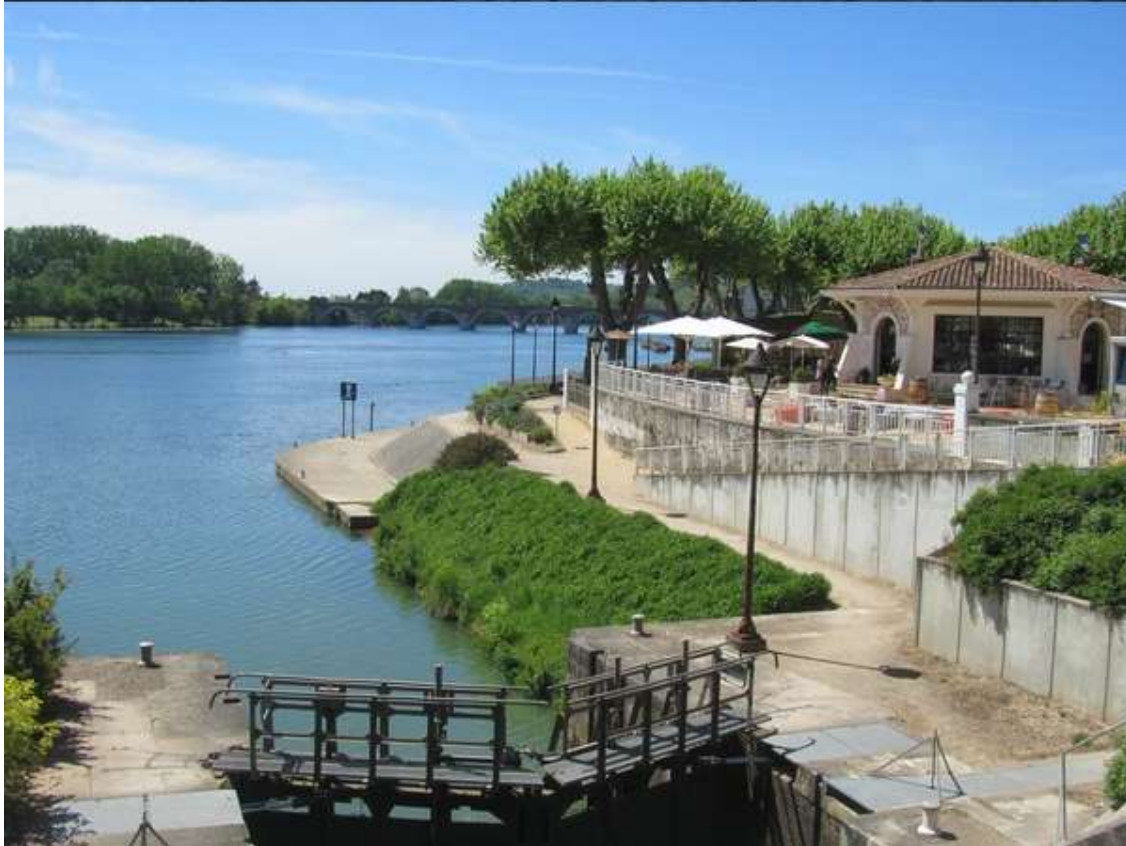
. Cahors et le méandre du Lot