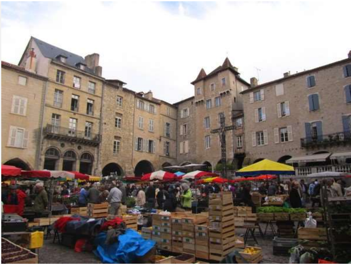
Le marché du jeudi à Villefranche de Rouergue, l'un des plus beaux de la région