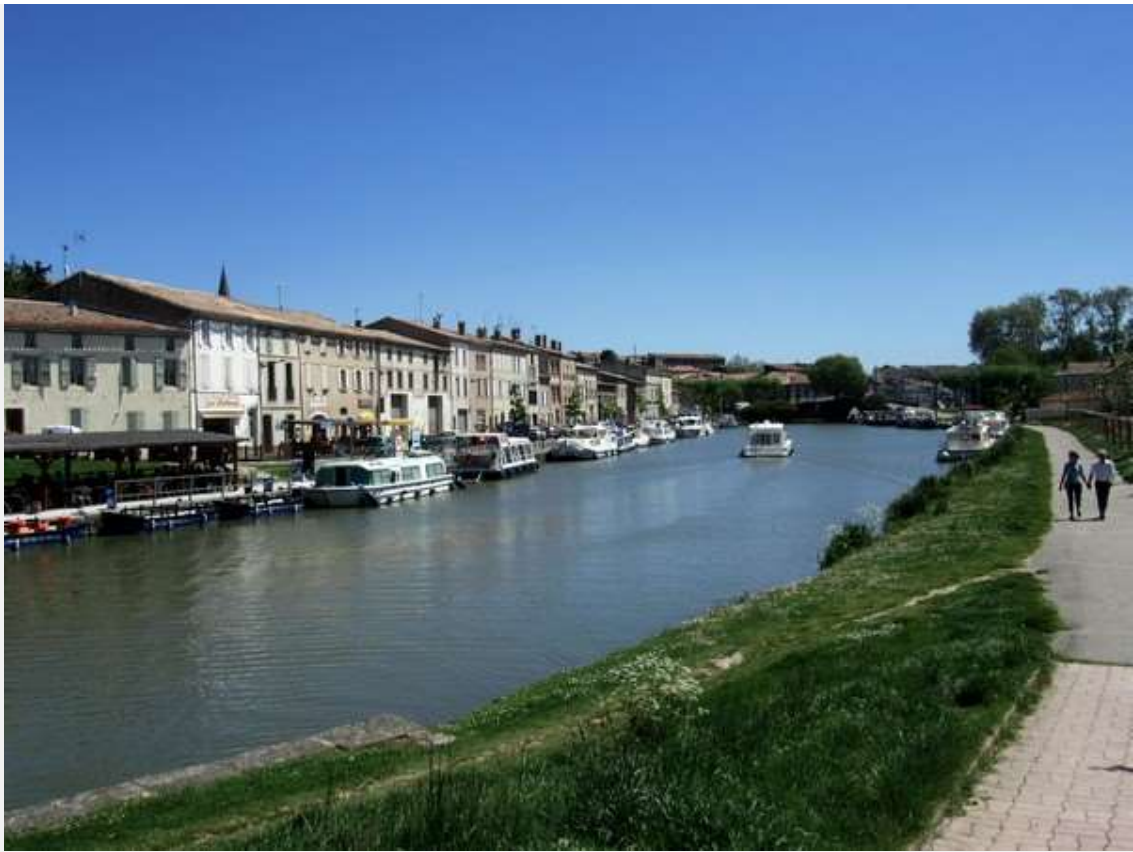
Le Canal du Midi à Castelnau-d'Aud