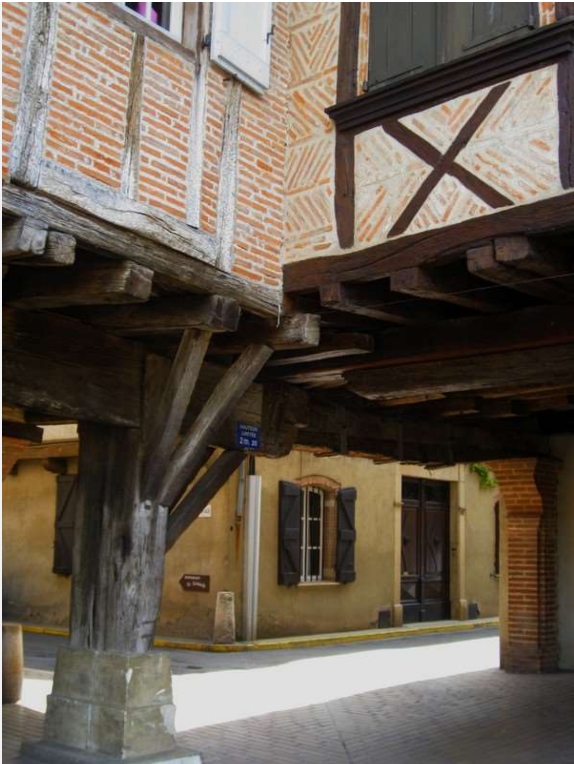
La bastide de l'Isle sur Tarn