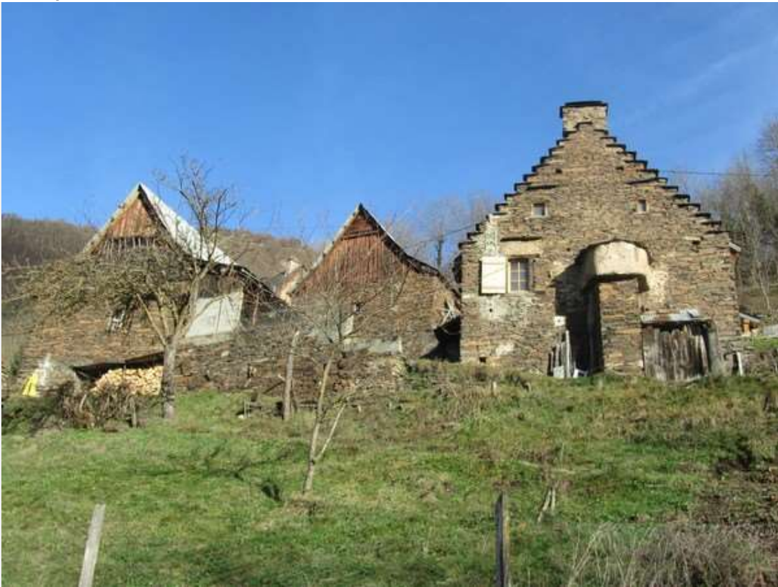
Dans la vallée de Luchon

Luchon est la 1ère station thermale des Pyrénées. On peut certes faire des petites randonnées aux alentours (de faible altitude parce que sans voiture pour atteindre les départs, à moins d'opter pour la télécabine jusqu'à Superbagnères été comme hiver). Mais on peut aussi se relaxer au vaporarium, unique en Europe. Pour en savoir plus : escapade montagnarde à Luchon . Et renseignez-vous sur le site de l' office du tourisme pour les itinéraires de balades et randonnées.