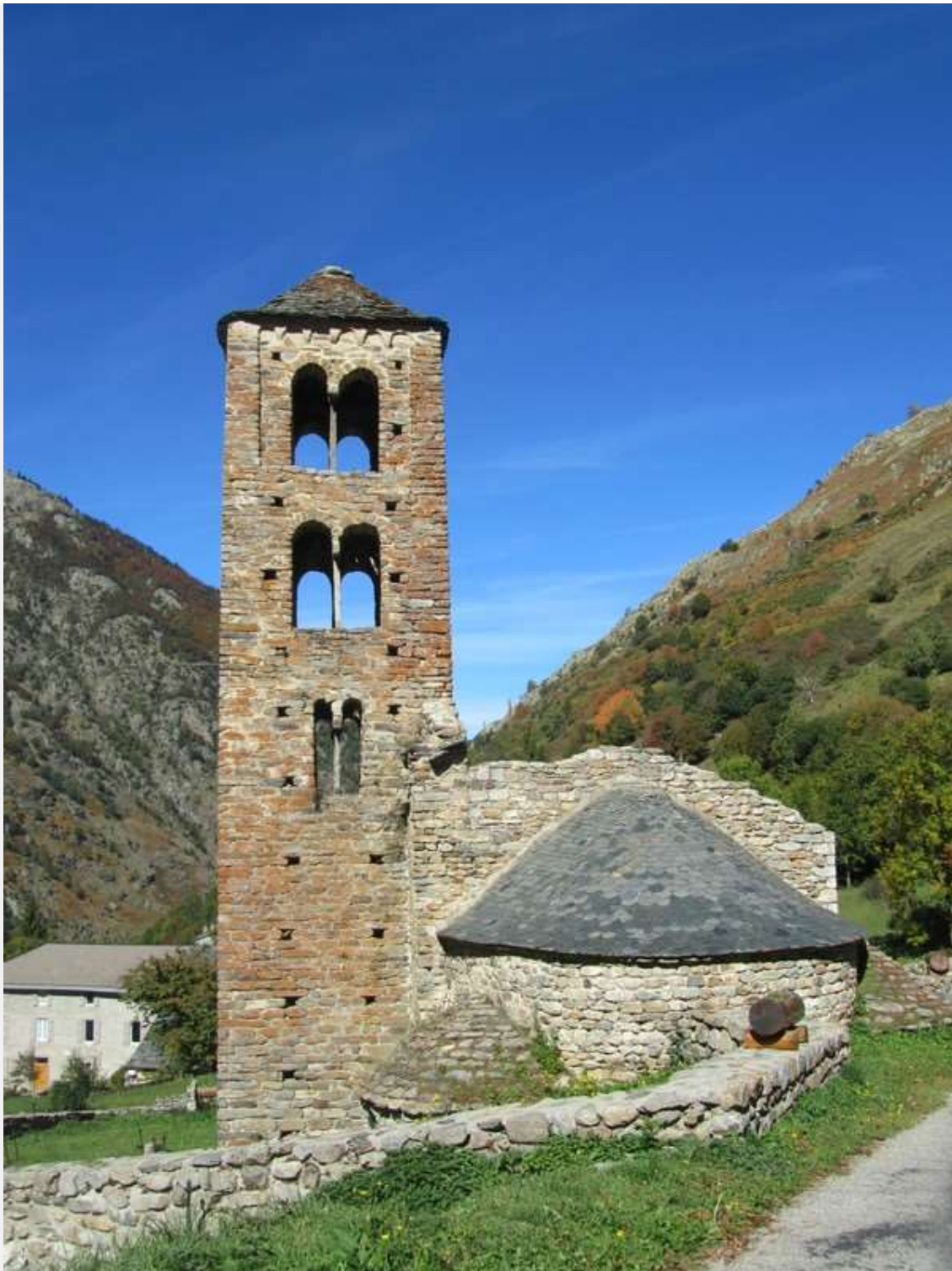
Merens-Les-Vals en haut du village

Le départ des randonnées se fait depuis les gares. Attention, il s'agit là de vraies randonnées avec dénivelés et non pas de balades en tenns. Si vous voulez juste vous promener, vous pouvez faire un tour d' Ax les thermes , ou prendre le téléphérique en saison (hiver et été), pour grimper à la station de ski.