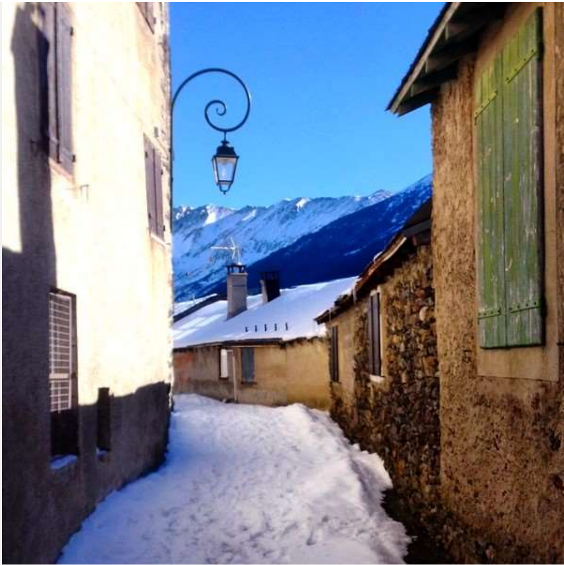
La village de Porté-Puymorens sur la ligne Toulouse-La Tour de Carol (66)