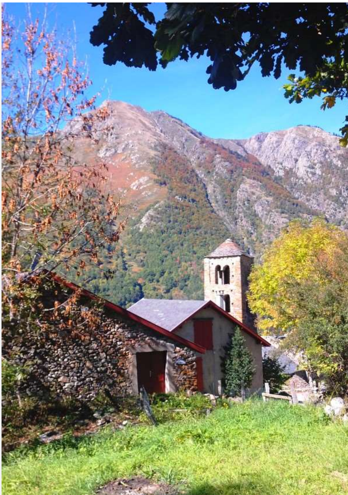
Merens-Les-Vals. Le GR10 y passe.