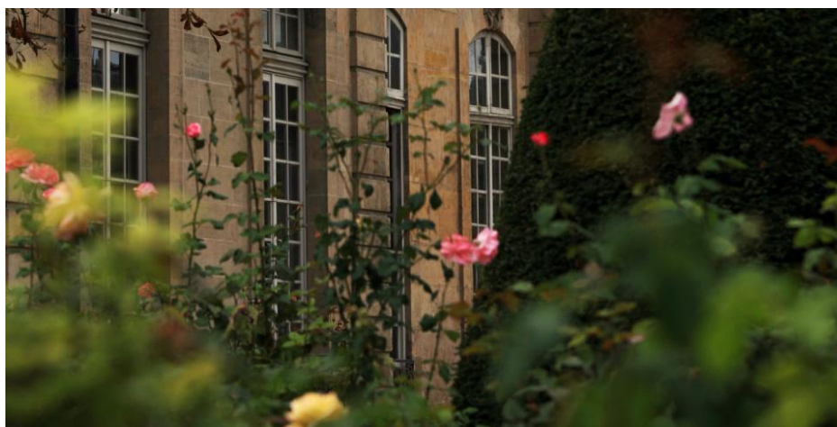
Musée Rodin, Paris, France

Au détour d'un bosquet, on tombe nez à nez avec Balzac, le Penseur, Les Bourgeois de Calais, La Porte de l'Enfer qui dominent de leur stèle ce magnifique jardin de sculptures.